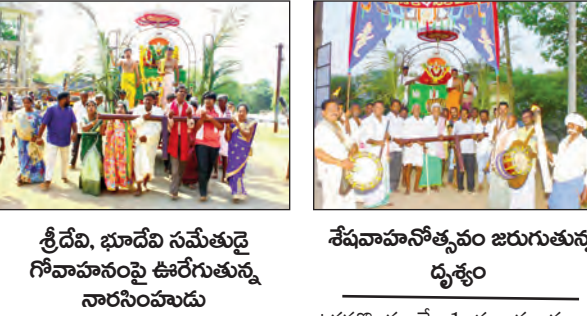
శ్రీదేవి, భూదేవి సమేతుడై గోవాహనంపై ఊరేగితున్న నారసింహుడు