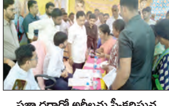
ప్రజా దర్శిలో అర్జీలను స్వీకరిస్తున్న దృశ్యం

చిన్న సమస్యలను ఆక్కడికక్కడే పరిష్కరించారు ఈ సందర్భంగా ఎమ్మెల్యే అమిలీనేని మాట్లాడుతూ గ్రామంలో నెలకొన్న సమస్యలను అధికారులు సకాలంలో పరిష్కరించాలని ముఖ్యంగా విద్యుత్, డ్రైనేజీ సమస్య, రస్తా సమస్యలను, భూ సంబంధిత సమస్యలను అధికారులు పది పది ప్రజలను కార్యాలయాలకు పంపిణీ చేయాలి అంటూ చూడాలని జిల్లా కలెక్టర్ కూడా ఎప్పటికప్పుడు స్పందిస్తారు కాబట్టి కింది స్థాయి అధికారులు కూడా వెంటనే స్పందించి పరిష్కరించాలని కోరారు మండల వ్యాప్తంగా శ్రీరామరెడ్డి తాగునీటి పథకం ద్వారా అందే తాగునీరు ప్రజలకు అందడం లేదని సమస్యను తగ్గించగలిగే పరిష్కరించాలని ఎమ్మెల్యే కలెక్టర్కు కోరారు. కార్డులు దిస్తే తప్ప సందర్భంగా కార్డులతో కలిసి కేక్ కట్ చేసిన ఎమ్మెల్యే గ్రీన్ ఆంధ్రానీడర్ లకు బట్టలు పంపిణీ చేశారు అనంతరం సీఎం రిలీఫ్ ఫండ్ కింద లబ్ధిదారులకు చెక్కులను వారికి అందించి ప్రజలకు ఎప్పటికప్పుడు కష్టాల్లో వెన్నంటి ఉండే పాత్రే తెలుగుదేశం పార్టీ అని అన్నారు. పట్టిక గ్రీవెన్స్ ప్రజా దర్శిలో 93 అర్జీలు పట్టినట్లు అధికారులు తెలిపారు ఈ కార్యక్రమంలో మండల వ్యాప్తంగా ఉన్న అధికారులు ప్రజాప్రతినిధులు మండల నాయకులు అధికారులు కార్యకర్తలు పెద్ద ఎత్తున పాల్గొన్నారు