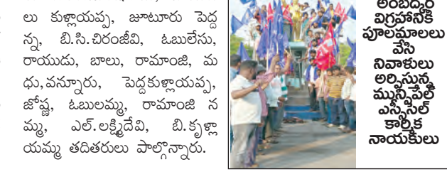
అంబేద్కర్ విగ్రహానికి పూలమాలలు వేసి నివాళులు అర్పిస్తున్న ఎస్సీ మున్సిపల్ కార్మిక నాయకులు