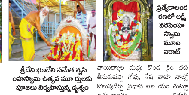
శ్రీదేవి భూదేవి సమేత స్వనింహస్వామి ఉత్సవ మూల విరాటకు పూజలు నిర్వహిస్తున్న దృశ్యం

ఉరవకొండ, మే 1 ప్రభాతవార్త ఉరవకొండ మండలం పరిధిలోని పెన్షన్ బోధలో జరుగుతున్న లక్ష్మీనరసింహస్వామి బ్రహ్మోత్సవాలలో భాగంగా సన్నతీ పూజనామ సంవత్సరం వైశాఖ శుద్ధ పౌర్ణమి శుభ్రవారం ఉదయం గోవాహనోత్సవం, సాయంత్రం శేషవాహనోత్సవం కన్నుల పండుగా జరిగాయి. ప్రత్యేకంగా అలంకరించిన శ్రీదేవి, భూదేవి సమేత స్వనింహస్వామి ఉత్సవమూలకు ప్రధాన ఆలయంలో పూజలు నిర్వహించిన అనంతరం మేళాకారులు మంగళ